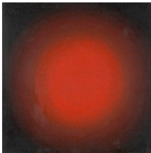
Τέχνη - Κρατικό Μουσείο Σύγχρονης Τέχνης

Βασικό μέρος του προγράμματος αποτελούν οι επισκέψεις σε μουσεία, πινακοθήκες, εκθεσιακούς και πολιτιστικούς χώρους, τα σεμινάρια, οι πρακτικές ασκήσεις και