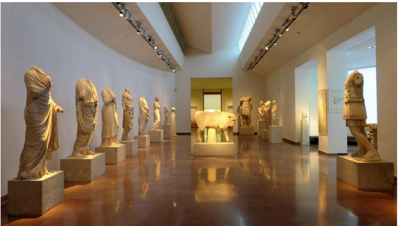
Ιστορία - Αρχαιολογικό Μουσείο Ολυμπίας

Ο ρόλος, η ανάπτυξη και η διαχείριση των μουσείων έχει αναπτυχθεί σε μεγάλο βαθμό τις τελευταίες δεκαετίες. Αντίστοιχα, έχει αναπτυχθεί εντυπωσιακά, στην Ελλάδα και διεθνώς, ο αριθμός των πανεπιστημιακών μαθημάτων, βιβλίων, συνεδρίων και άλλων δραστηριοτήτων που σχετίζονται με την «επιστήμη των μουσείων». Η Μουσειολογία έχει αναδειχθεί σε ένα από τα κατεξοχήν διεπιστημονικά ακαδημαϊκά αντικείμενα. Μελετά «την ιστορία των μουσείων, τον ρόλο τους στην κοινωνία, τις συγκεκριμένες μορφές έρευνας και συντήρησης, τις δραστηριότητές τους και τη διασπορά της γνώσης, την οργάνωση και λειτουργία τους, τη νέα ή «μουσειοποιημένη» αρχιτεκτονική, τα ευρήματα που παραλαμβάνουν ή επιλέγουν, την τυπολογία και δεοντολογία των μουσείων».